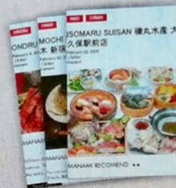
レストラン&レジャーガイド